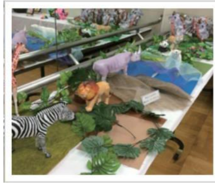
ペーパークラフト動物園