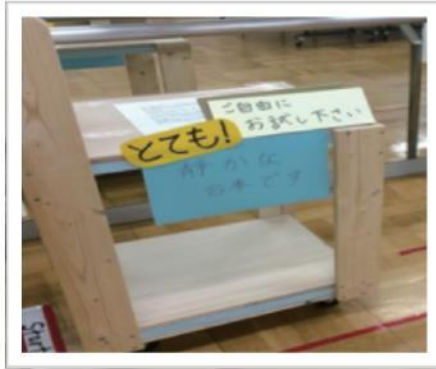
「とても静かな台車」の体験コーナー

平成27年10月16日～18日に恵庭市民会館で行われた「第60回えにわ市民文化祭」に今年度も当法人から出展させて頂きました。陶芸やプラモデル、ペーパークラフトや革細工など、患者さんが作業療法のプログラムで、社会生活機能向上を目的に作製した様々な作品を展示させて頂き、それを市民の方に見て頂ける素晴らしい機会になったと感じています。作品の中には何週間、何カ月とかけて作製された品も多く、患者さんからも、「この日のために、頑張ったよ!」との声を頂きました。